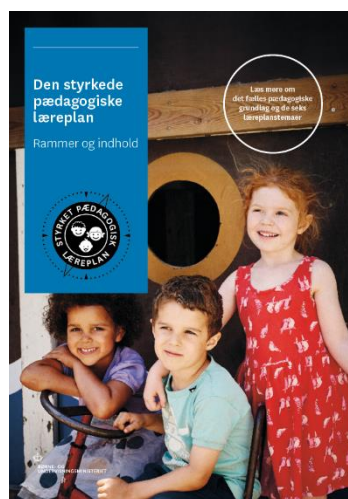
Den styrkede pædagogiske læreplan, Rammer og indhold

Inden for de krav, der følger af dagtilbudsloven, er det op til jer at beslutte, hvordan I konkret vil arbejde med den pædagogiske læreplan. Jeres læreplan skal være et dynamisk og meningsfuldt dokument, som peger fremad, og som I kan bruge aktivt i den løbende udvikling af den pædagogiske kvalitet og jeres pædagogiske praksis.